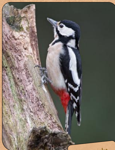
Le Pic épeiche