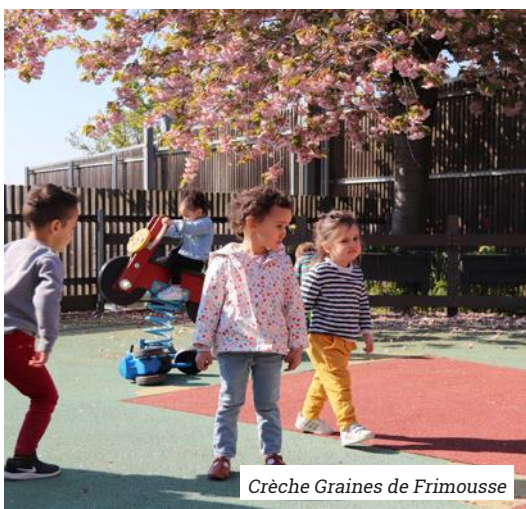
Crèche Graines de Frimousse

Aussi, le personnel de la crèche Graines de Frimousse était mobilisé pour accueillir une dizaine d'enfants âgés de 0 à 3 ans.